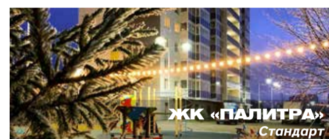
ЖК «ПАЛИТРА» Стандарт

Архитектурный стиль: выразительные цветовые решения домов