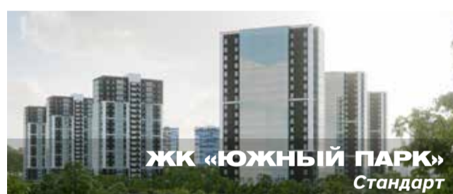
ЖК «ЮЖНЫЙ ПАРК» Стандарт

Архитектурный стиль: современные фасадные решения в лаконичной стилистике