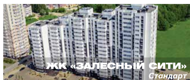
ЖК «ЗАЛЕСНЫЙ СИТИ» Стандарт

Архитектурный стиль: переменная этажность и контрастный фасад