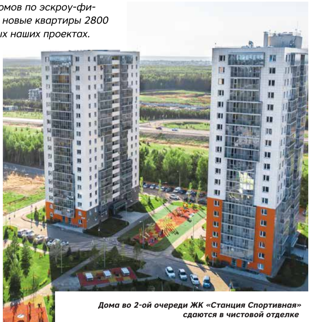
Дома во 2-ой очереди ЖК «Станция Спортивная» сдаются в чистовой отделке

Подчеркнем, что в домах 1.8 и 2.1, которые планируется запустить в продажу в этом году, будут представлены квартиры в чистовой отделке. К слову, они пользуются большой популярностью, ведь это выгодно, а также значительно экономит время и силы собственников.