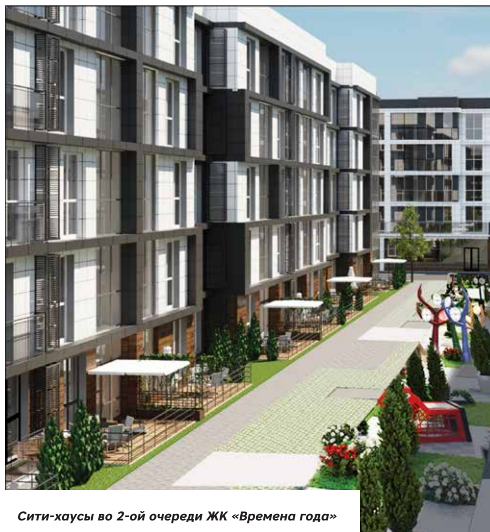
Сити-хаусы во 2-ой очереди ЖК «Времена года»