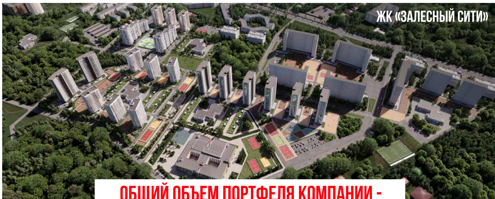
ЖК «ЗАЛЕСНЫЙ СИТИ»