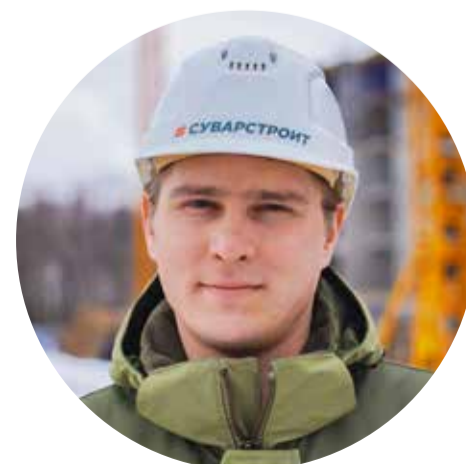
Руководитель проекта ЖК «Сказочный лес» Стаж работы на объектах более 6 лет