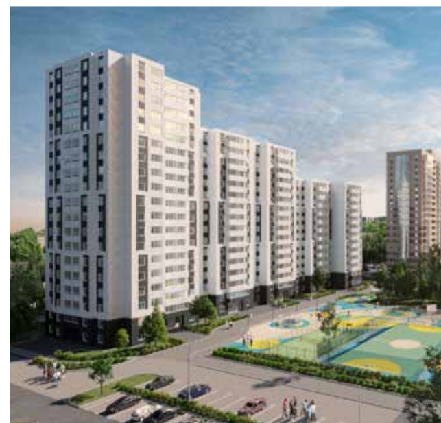
ЖК «ЗАЛЕСНЫЙ СИТИ»

Мы ставим амбициозные цели и уверенно их достигаем. В планах на 2020 год сдать более 120 тыс.м 2 жилья, в которые заселятся больше 2000 семей. К вводу запланированы 2-я очередь большого проекта жилого комплекса «Столичный» на улице Чистопольской (что эквивалентно типовым 7-8 домам), 2-я очередь «Южного парка» (состоит из 4 домов), а также четырехподъездный дом – 1.4, в жилом комплексе «Залесный сити».