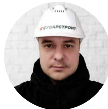
Начальник участка в #Суварстройт Защитник