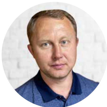
Энергетик в #Суварстройт Капитан команды

- Владимир, какими достижениями команды гордитесь? Что запомнилось особенно?