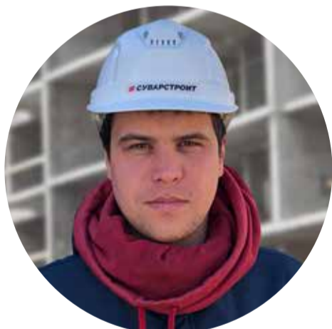
Заместитель генерального директора по строительству Стаж работы на объектах более 6 лет

Я пришел работать на объекты компании несколько лет назад на стройку жилого комплекса «Столичный» – тогда мы только начали этот проект.