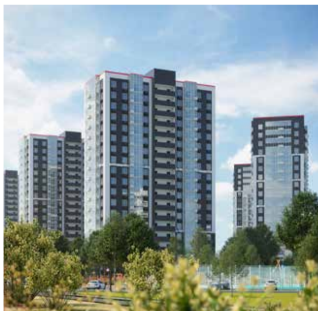
ЖК «ЮЖНЫЙ ПАРК»